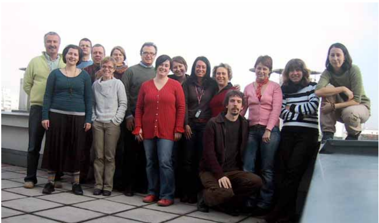
Projet d'envergure, encore à valoriser